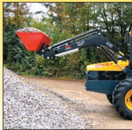
Frontlader mit Schüttgutschaufel