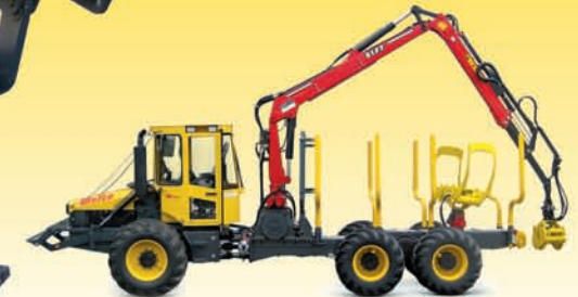
6-Rad Kombimaschine mit Rungenkorb und Klemmbank