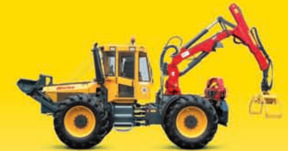
4-Rad Skidder mit Klemmbank