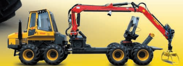
6-/8-Rad Forst- und Kombimaschine