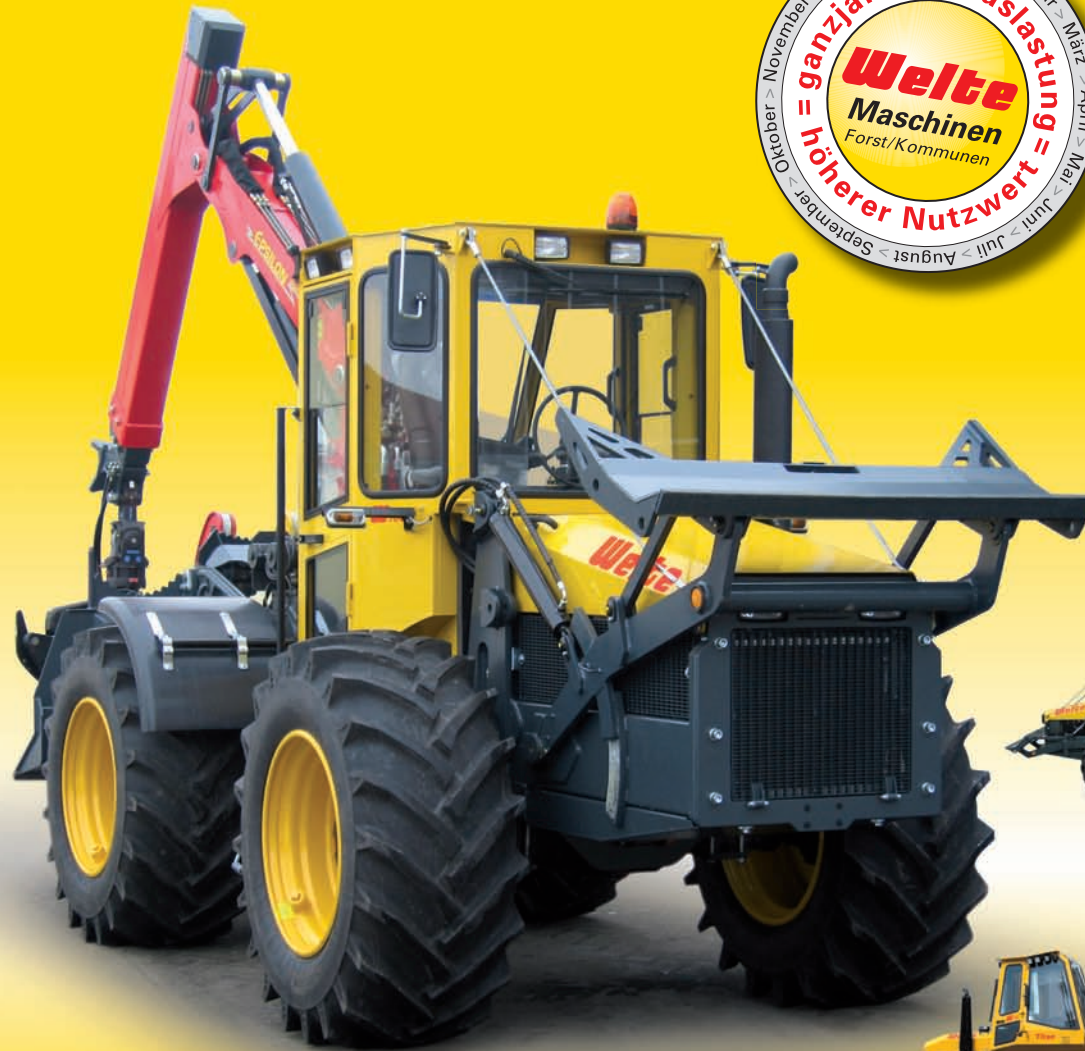
z. B. W130 4-Radmaschine, bis 40 km/h, 4-Zylinder