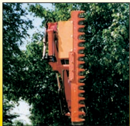
Baum- oder Freischneider