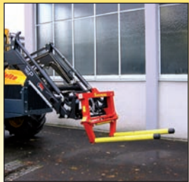
Frontlader mit Ballengabel