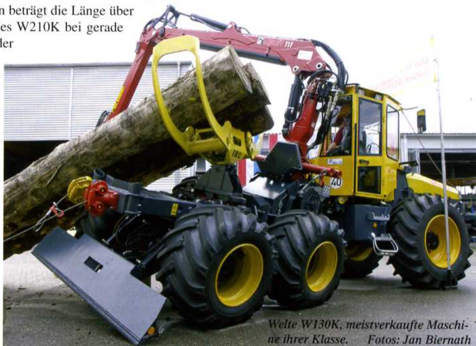
Welte W130K, meistverkaufte Maschine ihrer Klasse.