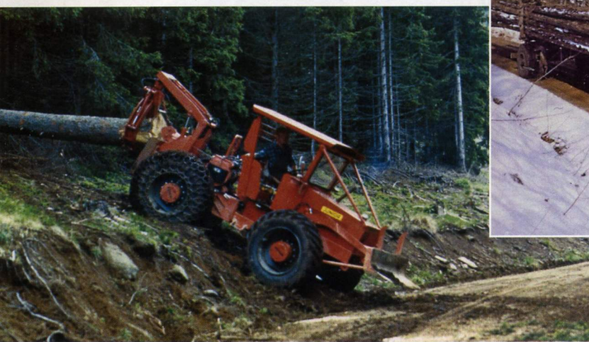
in Welte Junior Vierzylinder mit 72 PS, Doppeltrommelwinde, absenkbarem Heckschild mit integrierter Greifzange sowie Front- und Heckschild. Aufgenommen wurde das Bild im Jahr 1972 im Schwarzwald bei Lenzkirch.