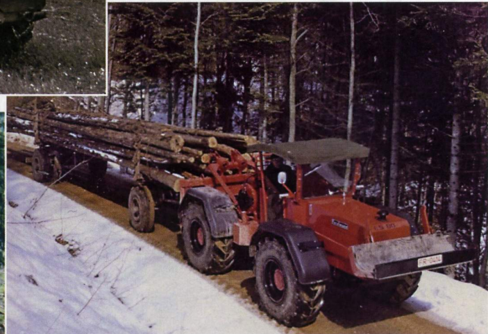
Oben: Dieses Bild entstand im Jahr 1967 und zeigt einen Forstmann ES 80 mit luftgekühltem Sechszylinder-Deutz-Motor beim Ziehen eines Gespannanhängers. Das Frontschild ist heb- und senkbar, das Heckschild ist absenkbar. Außerdem verfügt dieser Welte über eine Doppeltrommelwinde mit einer Zugkraft von zweimal acht Tonnen sowie eine automatische Anhängerkupplung.